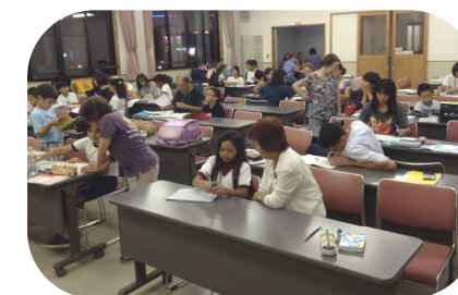
CHIKYUKKO HIROBA (Ano todo)

Para adultos . Aprenderá a língua japonesa através das aulas de japonês e conversação em grupo .