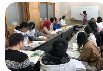
NIHONGO CAFE (Ano todo)

Para adultos . Aprenderá a língua japonesa através das aulas de japonês e conversação em grupo .