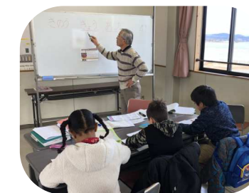
SUPORTE INICIAL (De vez em quando)

Para crianças . É feita a lição de casa da escola e o estudo da língua japonesa, aprendem o hiragana , katakana , kanji e as tabuadas .