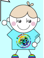
同じ誕生日のペア2組！おめでとう！