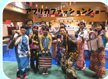
アフリカファッションショー