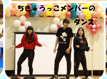
ちゅうごっこメンバーの ダンス