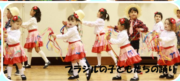
ブラジルの子どもたちの踊り