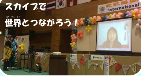
スカイプで 世界とつながろう!