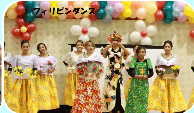
フィリピンダンス