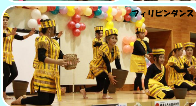
フィリピンダンス