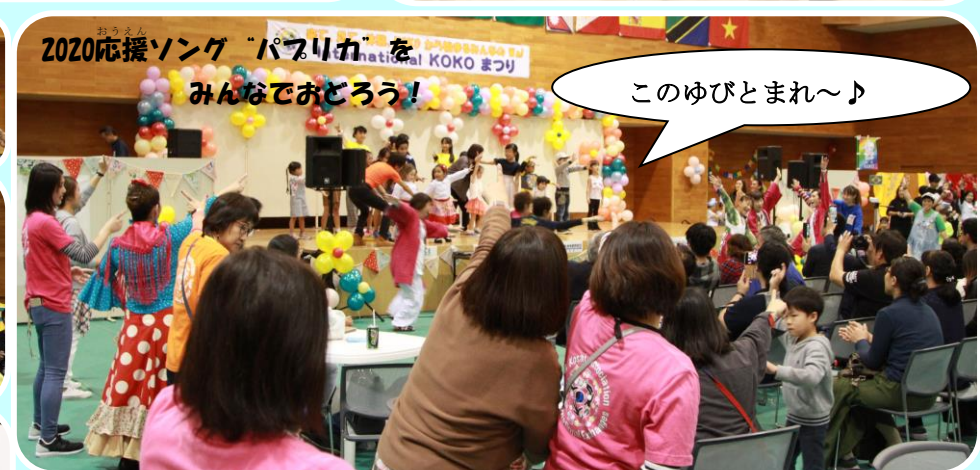
2020応援ソング「パプリカ」を みんなでおどろう!